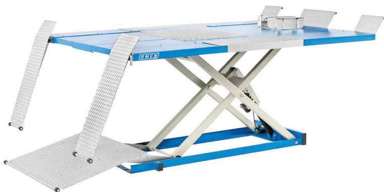
Table élévatrice 400V pour motos-quads-voiturettes